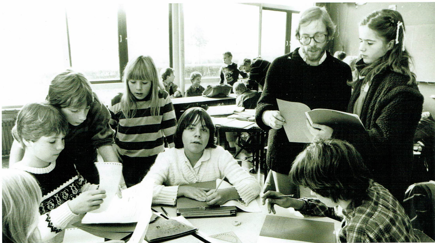
Leerlingen van de P.F. Overbeeke Middenschool te Utrecht tijdens een les maatschappij-oriëntatie, 1982.

Onderwijs is georganiseerde socialisatie, aldus Van Kemenade. ‘Dat betekent dat het onderwijs de leerlingen moet voorbereiden op bewuste deelname aan de samenleving, door ze kennis, inzicht en vaardigheden te geven en normen en waarden bij